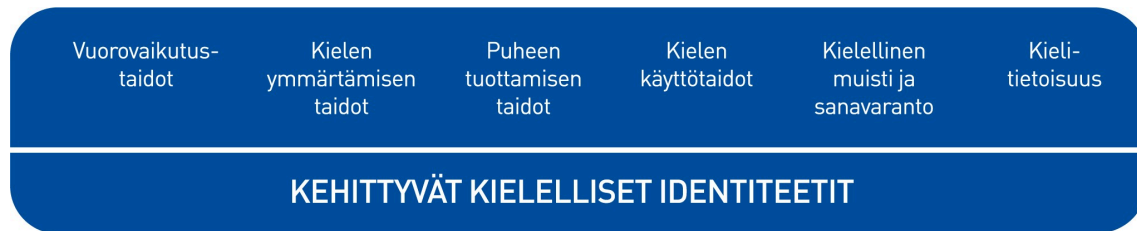
Kuvio 2. Lasten kielen kehityksen keskeiset osa-alueet varhaiskasvatuksessa

Kielen oppimisen kannalta on tärkeää tiedostaa, että saman ikäiset lapset voivat olla eri vaiheissa kielen kehityksen eri osa-alueilla. Kielelliset identiteetit kehittyvät , kun lapsia ohjataan ja tuetaan kielellisten taitojen ja valmiuksien keskeisillä osa-alueilla.